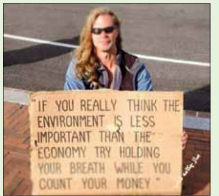
اگر واقعا فکر می کنید اهمیت محیط زیست کمتر از اقتصاد است، سعی کنید در حالی که نفتان را حبس کرده اید، پول هایتان را بشمارید!