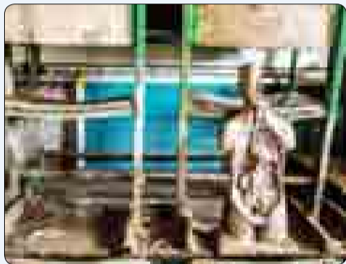
کلاس درس در روستای سیل زده چم مهر لرستان