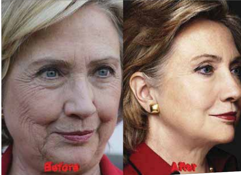
هیلاری کلینتون یکی از روشنی‌ترین سیاستمداران آمریکایی است که جراحی‌های زیبایی متعددی بارها سوزده رسانه‌های آمریکایی شده است. البته صورت تریزق فلور برکنده‌های صورت، جراحی افتادگی، یک پلاک کتفان بود. برداشتن پوست اضافه دور چوب‌لیف کردن، لیپوساکشن و بوتاکس از جراحی‌های زیبایی است که انجمنی رایج است و نسبت داده‌اند.

وقتی در تلویزیون یا رسانه‌ها تصویری از سالمندزبیا یا خوش‌تیپ ظاهر می‌شود، بی‌اختیار می‌گوییم خوش به حالشان، چقدر جوان مانده‌اند، انگار پیری فقط مال ماست... ولی سالمندی یک روند فیزیولوژیک است و با افزایش سن سلول‌ها و خانوادهاخواب‌پرتر می‌شوند. این روند در پوست صورت و کلاژن‌ها که وظیفه آن استحکام، انعطاف‌پذیری و بازسازی دائم پوست است، اتفاق می‌افتد و فرد دچار افتادگی یا چین و چروک در پوست می‌شود. گرچه شدت این فرآیند تحت تاثیر عوامل مختلفی در طول زندگی است و با رعایت نکته‌هایی می‌توان روند آن را به تاخیر انداخت ولی متوقف کردن آن با علم کنونی امکان‌پذیر نیست و برای زیباتر شدن در دوران سالمندی باید اعمالی روی پوست انجام شود. راز جوانی پوست سالمندان را باید در جراحی‌های زیبایی و گاهی هم هنر گریم جستجو کرد. موضوع این هفته صفحه «سالمندان» را به جوانسازی چهره سالمندان و وسیله جراحان پلاستیک اختصاص داده‌ام. گفت‌وگو را با ما دکتر محمدرضا قاضی سعیدی، فوق تخصص جراحی پلاستیک و زیبایی، در همین رابطه بخوانید و با دانشدات کارشناسان را نیز در ادامه دنبال کنید.