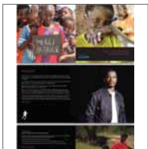
♥ Q R 000

ملبورن: آتش‌بازی برای شادی مردم صحنه‌ای که به اخبار سرگرمی‌ها و وقایعی که در ملبورن استرالیا می‌گذرد، اختصاص دارد؛ عکسی از مراسم آتش‌بازی در این شهر منتشر کرده و نوشته: «ساعت ۷:۱۵ هر شب جمعه در ماه آگوست (مرداد و اوایل شهریور)، برای سرگرم کردن و شادی بخشیدن مردم این شهر مراسم آتش‌بازی برگزار می‌شود.»