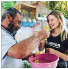
♥ Q R 000

دیانا آگرون: رنج هست اما زندگی ادامه دارد دیانا آگرون، بازیگر ۳۰ ساله آمریکایی، به دیدار پنهان‌گانی رفته که در اردوگاه زغری در اردن زندگی می‌کنند. آژانس پنهان‌گانی سازمان ملل متحد، عکسی از این دیدار منتشر کرده و نوشته: «اینجا خانه جالب ابوجمد در اردوگاه زغری است. ۲ پسر او در سواری کشته شدند و او همراه همسرش در این خانه زندگی می‌کند. ولی انعطاف این خانواده و شادی دوباره آنها قابل توجه است. با وجود فقدان عمیق، ابوجمد تلاش زیادی انجام داده تا این نقطه پناهگاه همان حس خانه‌شان در سواری را داشته باشد. او به یاد یکی از پسرانش در گوشه‌ای از خیابان‌های قفس‌هایی به رنگ روشن قرار داده، «آگرون هم گفته: «نمی‌توانم او و بسیاری خانواده‌های دیگر در زغری چگونه به چنین شیوه زندگی‌ای دست یافته‌اند، در حالی که آنها اسامی در وسط پایبان هستند و امکانات بسیار کمی دارند؟» این فقط ناشی از طرفیت بی‌نهایت روح بشر است که انسان‌ها بسیار رنج می‌برند ولی همچنان به زندگی ادامه می‌دهند و حتی شرایط رشد و پیشرفت را به چالش می‌کشند.»