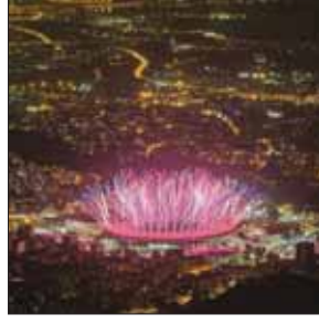
♥ Q R 000

ابوان مک گرگور: هوای کودکان جنگ‌زده را داشته باشیم یونیسف در یکی از پست‌های خود از سفر ابوان مک گرگور به عراق نوشته است. این بازیگر با خانواده‌هایی که در جنگ بی‌خانمان شده بودند، دیدار و گفت‌وگو و اعلام کرده است: «جهان با بحران بی‌سابقه پناهندگان رویارو شده و ما باید از تعداد فراوان کودکانی که به دلیل درگیری‌های خشونت‌آمیز از خانه و کاشانه‌شان دور افتاده‌اند، محافظت کنیم و برای آنها کارهای بیشتر و اثربخش‌تری انجام دهیم.»