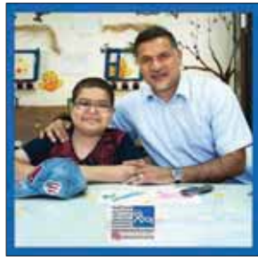
♥ Q R 000

پاتریس اورا: ۴۰۰ کودک در پناهگاه من پاتریس اورا، بازیکن ۳۵ ساله فوتبال فرانسه که در داکار سنگال به دنیا آمده، از سال ۲۰۱۲ با یونیسف برای حفاظت از کودکان سرزمینش همکاری داشته. او بارها گفته بود که من نسبت به کودکان زادگاهم احساس مسولیت می‌کنم و باید برای آنها کاری انجام دهم. حالا این فوتبالیست در صفحه اینستاگرامش نوشته: «پناهگاهی که من برای کودکان مهیا کرده بودم، حالا ۴۰۰ کودک را تحت پوشش قرار داده است.»