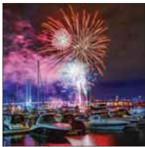
♥ Q R 000

دیانا آگرون: رنج هست اما زندگی ادامه دارد دیانا آگرون، بازیگر ۳۰ ساله آمریکایی، به دیدار پنهان‌گانی رفته که در اردوگاه زغری در اردن زندگی می‌کنند. آژانس پنهان‌گانی سازمان ملل متحد، عکسی از این دیدار منتشر کرده و نوشته: «اینجا خانه جالب ابوجمد در اردوگاه زغری است. ۲ پسر او در سواری کشته شدند و او همراه همسرش در این خانه زندگی می‌کند. ولی انعطاف این خانواده و شادی دوباره آنها قابل توجه است. با وجود فقدان عمیق، ابوجمد تلاش زیادی انجام داده تا این نقطه پناهگاه همان حس خانه‌شان در سواری را داشته باشد. او به یاد یکی از پسرانش در گوشه‌ای از خیابان‌های قفس‌هایی به رنگ روشن قرار داده، «آگرون هم گفته: «نمی‌توانم او و بسیاری خانواده‌های دیگر در زغری چگونه به چنین شیوه زندگی‌ای دست یافته‌اند، در حالی که آنها اسامی در وسط پایبان هستند و امکانات بسیار کمی دارند؟» این فقط ناشی از طرفیت بی‌نهایت روح بشر است که انسان‌ها بسیار رنج می‌برند ولی همچنان به زندگی ادامه می‌دهند و حتی شرایط رشد و پیشرفت را به چالش می‌کشند.»