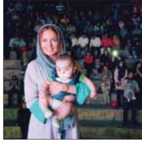
♥ Q R 000

موسه خیری به بنام دهنش پور: علی دایی به خاطر پوریا آمد موسسه خیری به بنام دهنش پور، این عکس را در یکی از پست‌هایش گذاشته و ماجرای مربوط به آن را این‌طور تعریف کرده است: «علی دایی آرزوی پوریا را برآورده کرد... این بار ماجرا از یک درخت شروع شده درختی که در کتابخانه کودکان خیری به نام دهنش پور نامش را «درخت آرزوها» گذاشته‌اند. کودکان مبتلا به سرطان می‌آیند و آرزوهایشان را روی درخت آویزان می‌کنند و مردم نیکوکار هم که بچه‌ها آنها را فرشته‌های زمینی می‌نامند، می‌آیند و این آرزوها را برآورده می‌کنند تا کودکان برای سلامت خود نیز امید داشته باشند. وقتی به آرزوی پوریا رسیدیم، فکر می‌کردیم آرزوی غیرممکن باشد. روی قلب آرزوی پوریا نوشته شده بود: «علی دایی! همه فکر می‌کردند من می‌میرم. من می‌میرم اما همیشه باید او را فقط در تلویزیون ببینم، به خاطر آرزوی پوریا ۹ ساله به یکی از شلوغ‌ترین بیمارستان‌های تهران بیاید! اما برخلاف تصورمان همه چیز به سادگی رقم خورد؛ وقتی مسولان کتابخانه کودکان با او تماس گرفتند، با وجود اینکه باید سر تمرین نفت تهران حاضر می‌شد، گفت حتما خواهد آمد.»