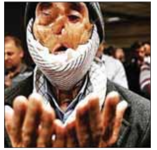
♥ Q R 000

گاردین اسپریت: یک عکس دیدنی! گاردین اسپریت عکسی از مراسم افتتاحیه المپیک ریو ۲۰۱۶ گذاشته که مربوط به آتش‌بازی در ورزشگاه ماراکانا در شهر ریودوژانیرو است و در شرح آن به همین سه کلمه بسنده کرده است: «یک عکس دیدنی.»