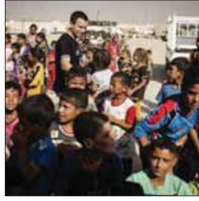
♥ Q R 000

محمدعلی بهمنی: مرد عمل نبودم اگر، عاقبت شدم! «مرد عمل نبودم اگر، عاقبت شدم!» این تیرگی را در عکس‌هایی است که محمدعلی بهمنی، شاعر و ترانه‌سرا در صفحه شخصی‌اش گذاشته. او که محل عکس‌هایش بیمارستان مدرس بوده، در این بیمارستان تحت‌عمل موفق جراحی قلب قرار گرفته و یکی از دوستانش در توضیح احوال او نوشته: «ساعت‌ها اضطراب و بلاکنکلیفی اینکه بالاخره متخصص قلب اجازه عمل جراحی برای استاد بهمنی صادر می‌کند یا نه، به جایی ختم شد که همه مطمئن شدیم جراحی انجام نخواهد شد، اما ناگهان گفتند که لباس عمل را بپوشید چون دکتر مجوز داده است.» خوشبختانه حال این استاد مهربان که همیشه لبخندی بر لب دارد، خوب است.